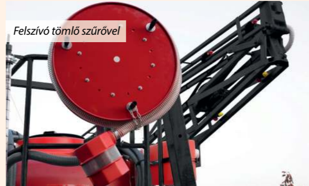
Felszívó tömlő szűrővel