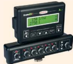
BRAVO 180S vezérlés elektromos szakaszolóval

* Tényleges tartályméret: PROCROP ML 2200: 2440 liter, PROCROP ML 3000: 3450 liter A habképződés miatt a tényleges és névleges tartályméret közötti különbségre figyelni kell.