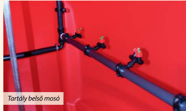
Tartály belső mosó